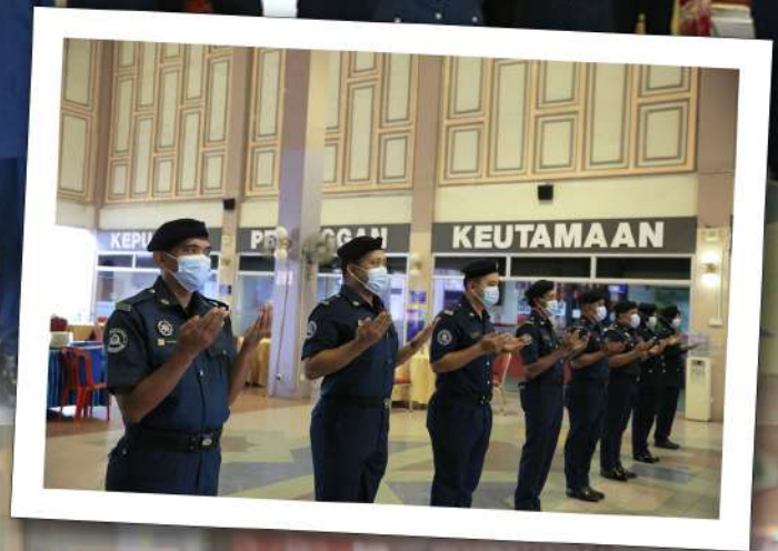
Selamat Datang Yang Dipertua Baharu Ke MPK