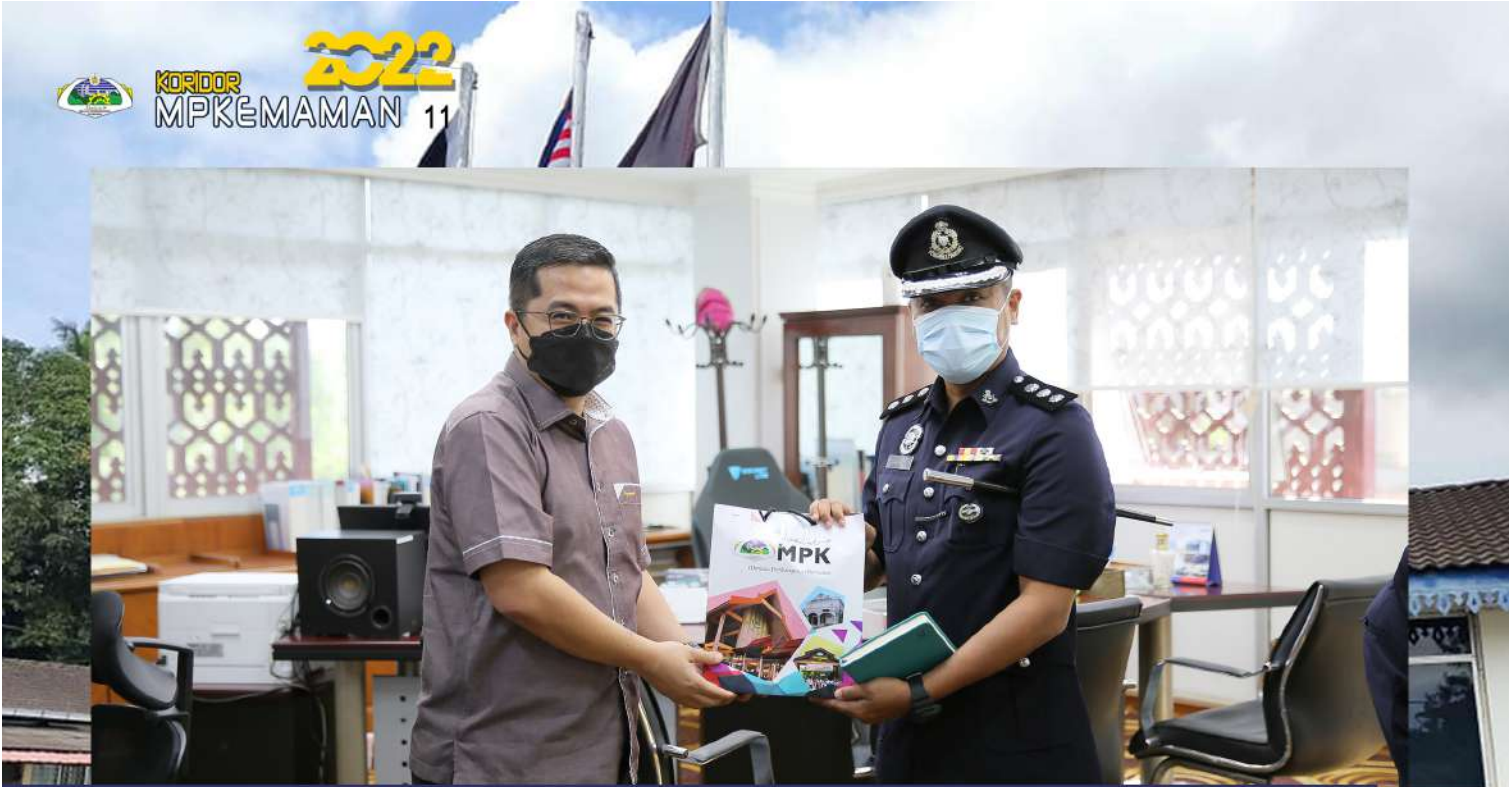
Kunjungan Hormat Ketua Polis Daerah Kemaman Ke MPK