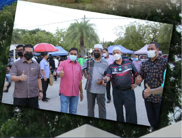
LAWATAN KE TAPAK BAZAR RAMADAN (PBT) NEGERI TERENGGANU