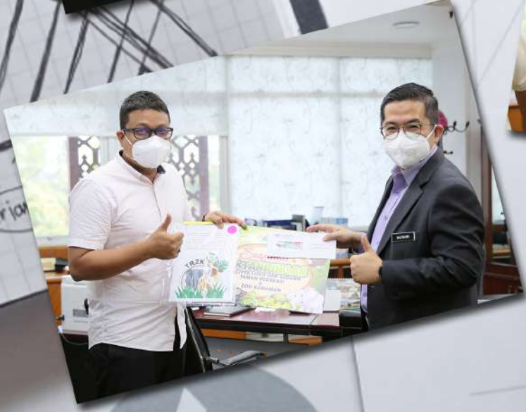
PENYAMPAIAN HADIAH PROGRAM PERTANDINGAN MENCIPTA LOGO DAN SLOGAN TAMAN REKREASI & ZOO KEMAMAN